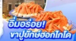
อิมมอร์ออย! ทาปูยักซ์ฮอกไกโด