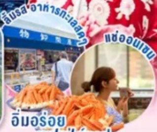
อิมอร้อย บุฟเฟ่ต์งาปู... และออนเซน

📍 ไฮไลท์!! นั่งกระเช้าชมวิวทิวทัศน์ขึ้นภูเขา Omuro (ตามรอยอนิเมะชื่อดัง) ชมซากุระ ณ หมู่บ้านโอชิโนะฮักโกะ วิวภูเขาไฟฟูจิสีทิวทัศน์กับพื้นหลังสีฟ้า เทียว เมืองอาโอยุ จ.อิบารากิ เมืองซายาฮาดทะเลญี่ปุ่นตะวันออก ช้อปปิ้งใจ ชินจูกุ พร้อมเช็คอิน แลนด์มาร์คแห่งใหม่ แมวยักษ์ 3 มิติ บุฟเฟ่ต์งาปู และผ่อนคลายกับการแช่น้ำแร่ธรรมชาติ (ออนเซน)