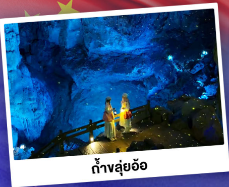
ถ้ำลุย้อ

"ดินแดนแห่งสาขาน้ำและภูเขา" สัมผัสประสบการณ์นั่งบอลลูนชมวิวมุมสูง