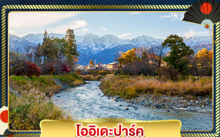
โออิเคะปาร์ค