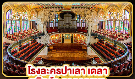
โรงละครปาลาเดอ มูสิคก้า คาทาลานา