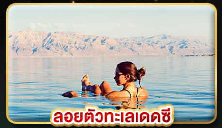
ลอยตัวทะเลเดคซี