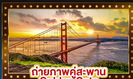
ถ่ายภาพคู่สะพาน Golden Gate