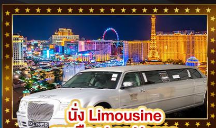
นั่ง Limousine ชมเมือง Las Vegas