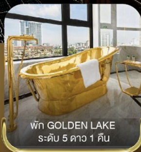
พัก GOLDEN LAKE ระดับ 5 ดาว 1 คืน