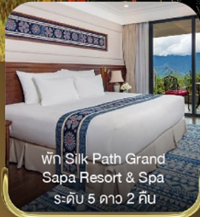
พัก Silk Path Grand Sapa Resort & Spa ระดับ 5 ดาว 2 คืน