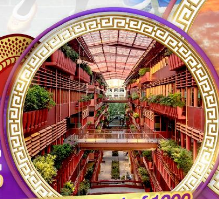
The street of 1000 red jars