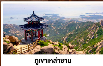
กูเงาเหล่าซาน