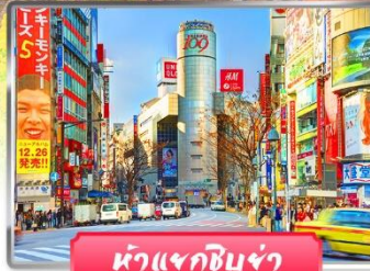
หน้าแจกชิบูย่า

✓ มั่งคั่งวิว 360 องศา ณ กระเช้า คางิคาจิ