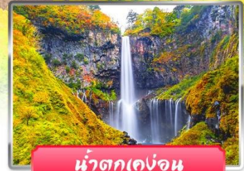
น้ำตกเคงอน