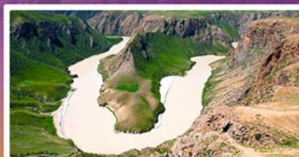
แกรนด์แคนยอนดูซานจื่อ