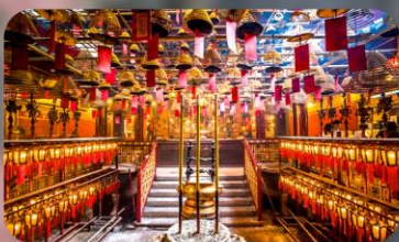
วัดหม่านโม