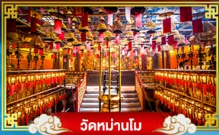
วัดหม่านโม

พักผ่อน "ริมฟ้ารุ่ง" บินรดลองเทศกาลปีใหม่ ณ เกาะฮ่องกง