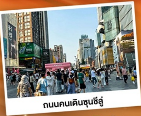
ถนนคนเดินชุนชี่อู่