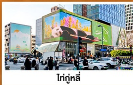
ไท่กู่หลี่