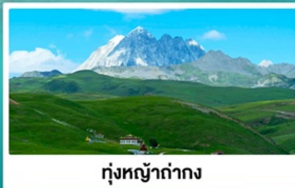
ทุ่งหญ้าท่ามกลาง