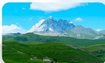
ทุ่งหญ้าด่าง