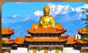
วัดพระใหญ่ทวงกงซาน