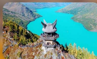
ศาลาชมปลา