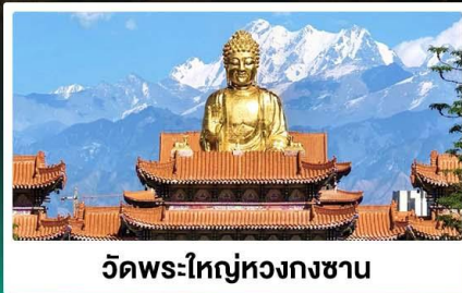
วัดพระใหญ่หวงกงซาน