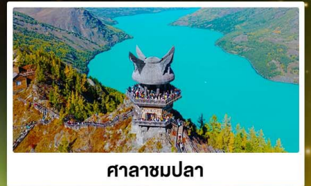
ศาลาชมปลา