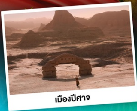
เมืองปีศาจ