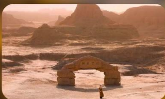
เมืองปีศาจ