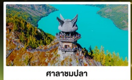
ศาลาชมปลา