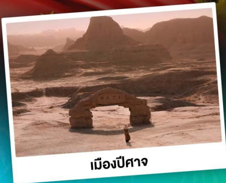
เมืองปีศาจ