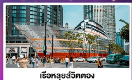
เรือทูลุยส์วัดตอง