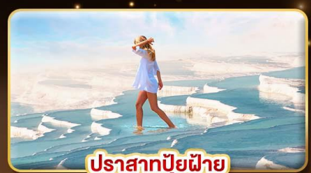
ปราสาทปูยฝ้าย