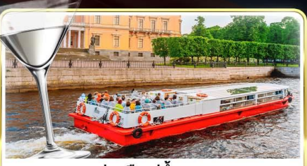
ส่องเรือแม่น้ำแคว พร้อมเสิร์ฟ Vodka Tasting