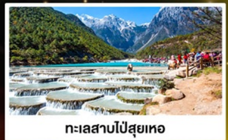
ทะเลสาบไป๋สือเหอ