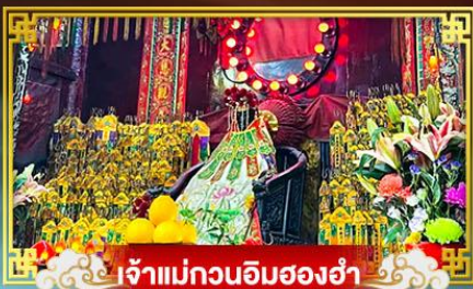
เจ้าแม่กวนอิมฮองอ่า

เที่ยว 2 เมือง ขึ้นไปอยู่ที่เกาะฮ่องกง เที่ยวจู่ไห่สวนสนุกและอควาเรียมที่ใหญ่ที่สุดในเอเชีย