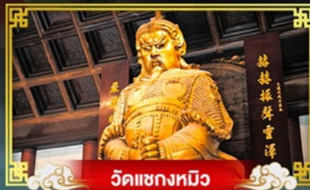
วัดเซกตหมิว