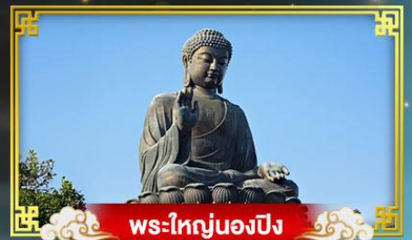
พระใหญ่หนองปิง