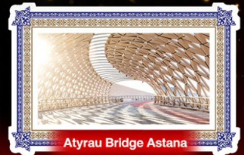
Atyrau Bridge Astana