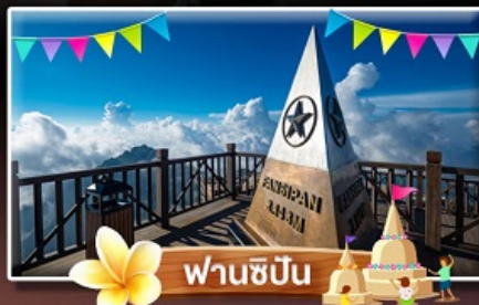
ฟานชิปัน