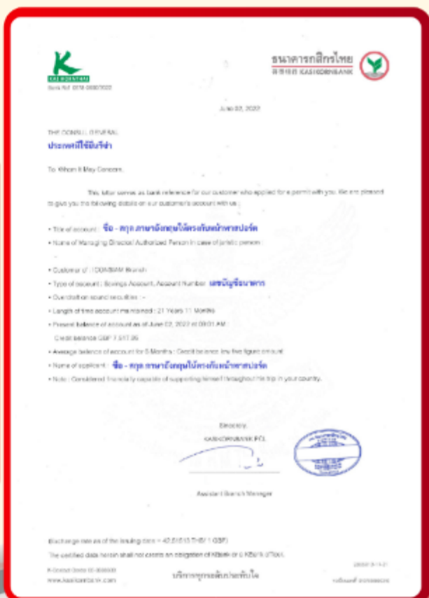
ตัวอย่าง Bank Statement ที่ผู้สมัครต้องขอจากธนาคาร