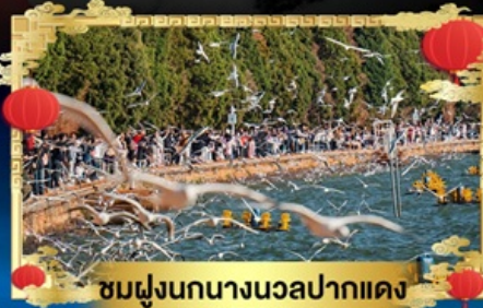
ชมฝูงนกนางนวลปากแดง