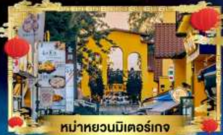
หม่าหยวนมิเตอร์เกจ