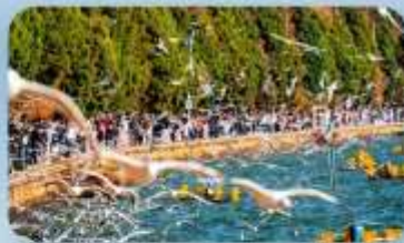
ชมฝูงนกนางนวลปากแดง