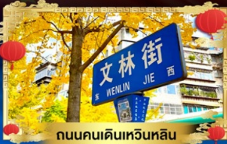
ถนนคนเดินหวินหลิน