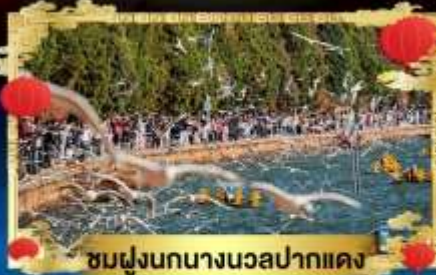
ชมฝูงนกนางนวลปากแดง