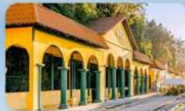
หม่าหยวนมิเตอร์เกจ