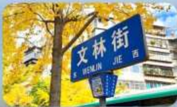
ถนนคนเดินเทวินหลิน