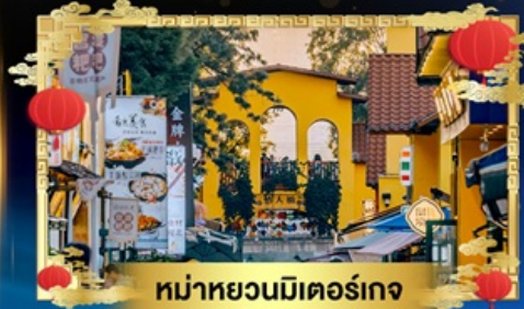
หน้าหยวนมิเตอร์เกจ