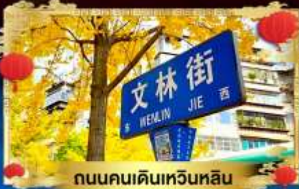
ถนนคนเดินเหวินหลิน

เที่ยวภูเขาหิมะใกล้ๆ จีนเพียง 2 ชั่วโมง "สัมผัสบรรยากาศความหนาวเย็นแบบถอดใจ"