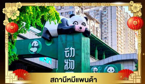
สถานีหมีแพนด้า