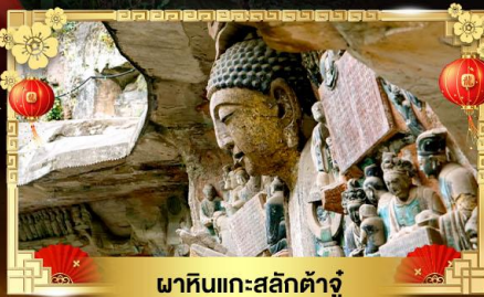
ผาหินแกะสลักต้าจู้