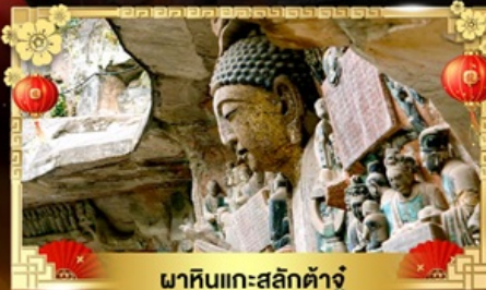
พาคินแกะสลักต้าจู้