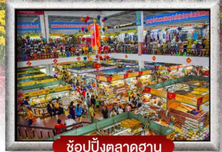
ซ้อปิ้งตลาดฮาน