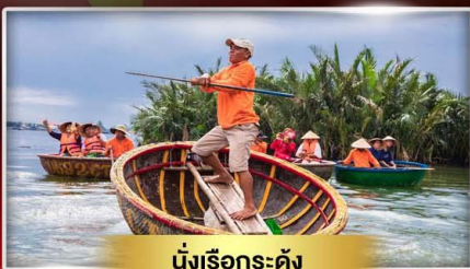
นั่งเรือกระดง