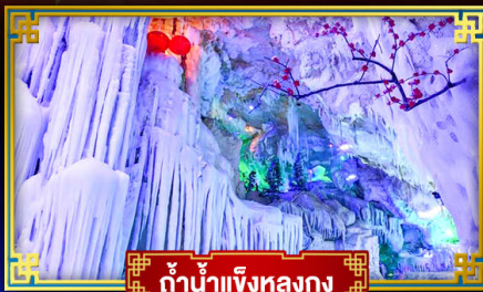
น้ำตกเจียงหลงกวง

"เที่ยว 2 มณฑล กวางสี-กวางโจว" สุดอลังการ น้ำตก 2 พรมแดน แหล่งท่องเที่ยวระดับ 5A