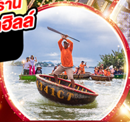
นั่งเรือกระดัง