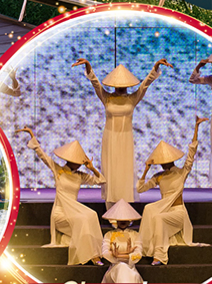
Charming Danang Show