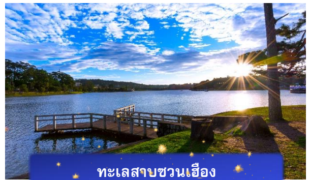
ทะเลสาบชวนเอื่อง

ที่พัก The Western Hill ระดับ 4 ดาวหรือเทียบเท่า