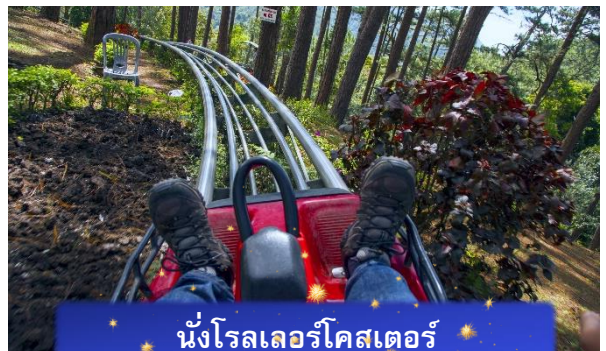
นั่งโรลเลอร์โคสเตอร์