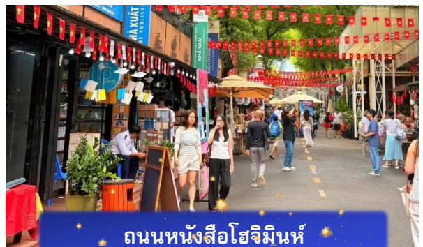
ถนนหนังสือโฮจิมินห์

18.30 เดินทางถึง สนามบินสุวรรณภูมิ ประเทศไทย โดยสวัสดิภาพ ... พร้อมความประทับใจ