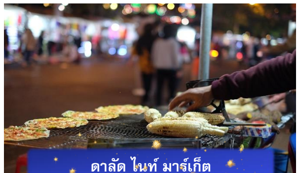
ดัลลัด ไนท์ มาร์เก็ต

The Western Hill ระดับ 4 ดาวหรือเทียบเท่า