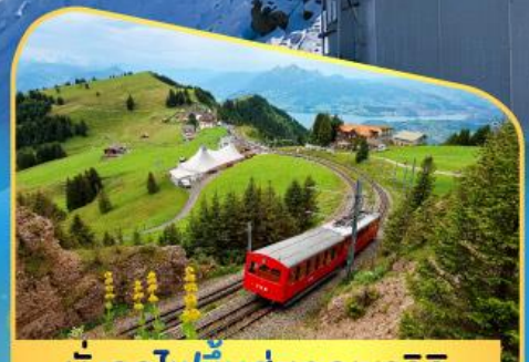
นั่งรถไฟขึ้นสู่ยอดเขาโรทิก