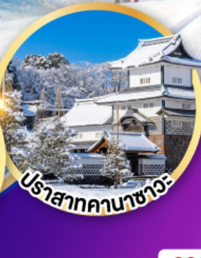
ปราสาทคานาซาว่า