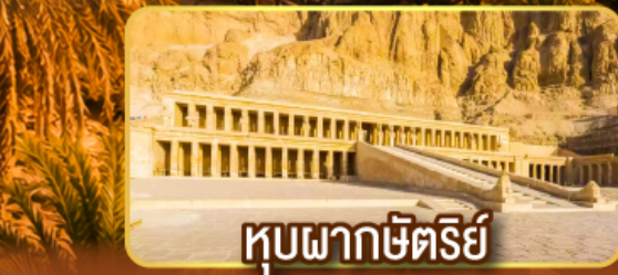
หุบผากษัตริย์