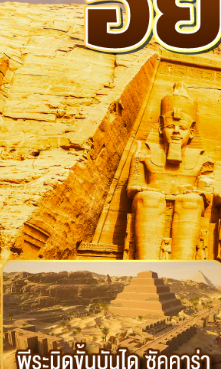
พีระมิดขั้นบันได ชัคคาร์่า