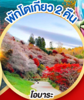
พักโตเกียว 2 คืน