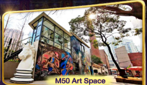
M50 Art Space