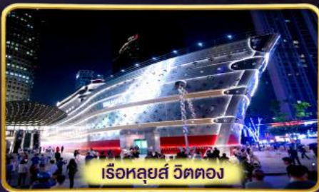
เรือหลุยส์ วัดตอง