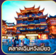
ตลาดฉินหวงเมี่ยว