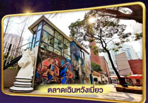
ตลาดเดินหวังเมี่ยว