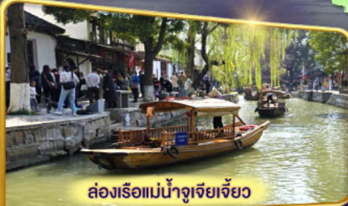
ล่องเรือแม่น้ำจูเจียงเจี๋ยว