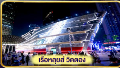
เรือหลุยส์ วิตตอง