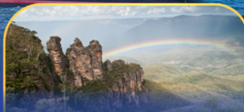
อุทยานแห่งชาติบลูเมาท์เทนส์ Three Sister Rock