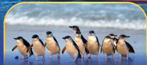
พาหระดนกเพนกวิน