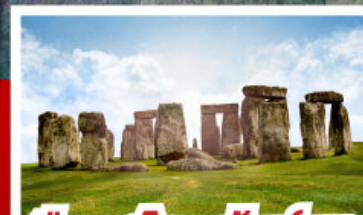
เขื่อนสโตนเฮ็นจ์ และ พิพิธภัณฑน์โรมันบาร