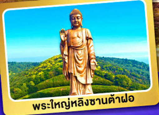
พระใหญ่หลังซานต้าฝอ