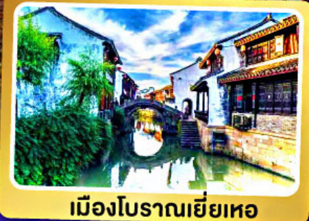
เมืองโบราณเยี่ยเหอ