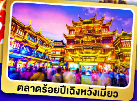
ตลาดร้อยปีเจิ้งหวังเมี่ยว