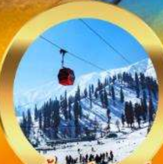
เคเบิลคาร์ กุลมาร์ค