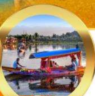
ล่องเรือซิการา