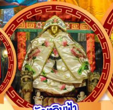
วัดเลินฟ้า