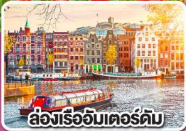
ล่องเรืออัมสเตอร์ดัม