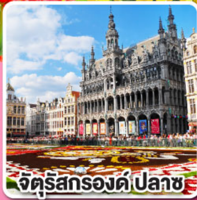
จัตุรัสกรอนด์ ปลาซ

ล่องเรือหลังคากระจาก ชมความสวยงาม ของกรุงอัมสเตอร์ดัม