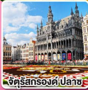
จัตุรัสกรองด์ ปลาซ

ล่องเรือหลังคากระจก ชมความสวยงาม ของกรุงอัมสเตอร์ดัม