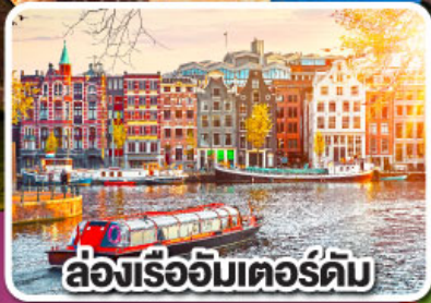
ล่องเรืออัมสเตอร์ดัม

เยอรมนี เนเธอร์แลนด์ เบลเยียม ฝรั่งเศส 8 วัน 5 คืน