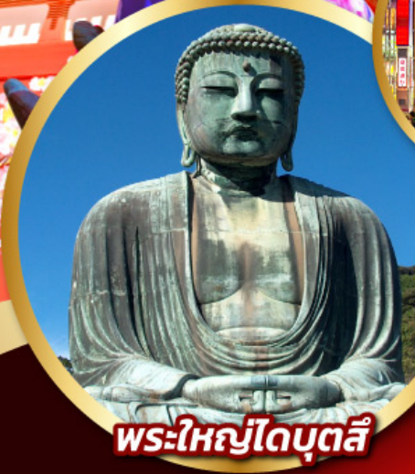
พระใหญ่โตบุตสึ