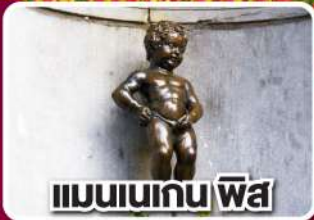
แมนเนเกน ฟิส