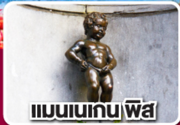
แมนเนเกน พิส