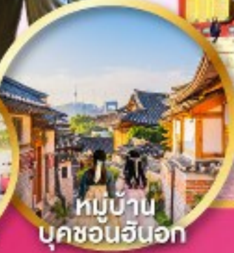
หมู่บ้าน บุคซอนฮันอก