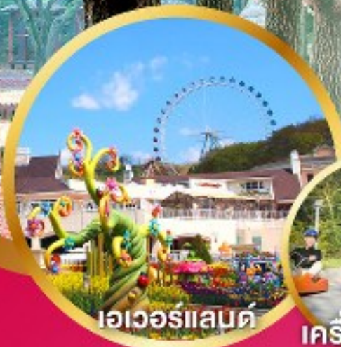
เอเวอร์แลนด์