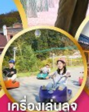
เครื่องเล่นลูจ