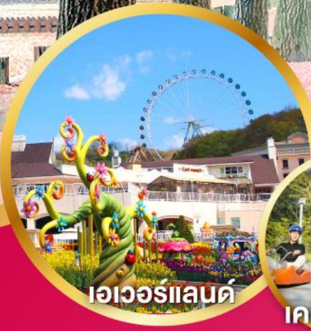
เอดเวิร์ลแลนด์