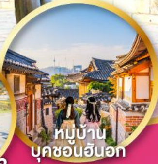
หมู่บ้าน บุคซอนอันอก

เทศกาล สงกรานต์ ชมความสวยงาม ของดอกซากุระ ที่สวนยอฮโด ใจกลางกรุงโซล