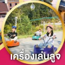
เครื่องเล่นลู่จ