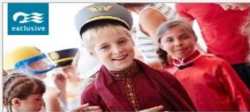
Discovery at SEA Programs