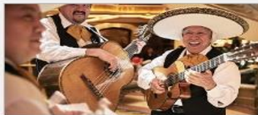
Music & Dancing