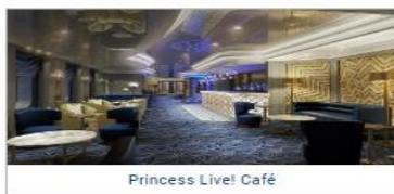
Princess Live! Café