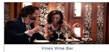
Vines Wine Bar