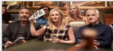
Art Gallery & Auctions