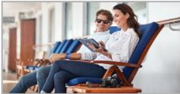
The Best Wi-Fi at Sea