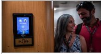
Keyless Stateroom Entry