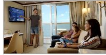
Simplified Safety Training