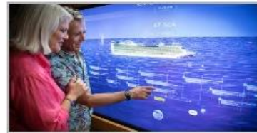
Events On Board