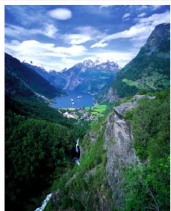
Gieraner , Norway