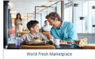
World Fresh Marketplace