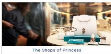
The Shops of Princess