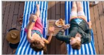
Whatever You Need, Delivered