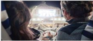
Movies Under the Stars®

On every Princess ship, you'll find so many ways to play, day or night. Explore The Shops of Princess, celebrate cultures at our Festivals of the World or learn a new talent – our onboard activities will keep you engaged every moment of your cruise vacation. 1