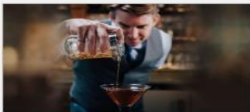
Good Spirits At Sea