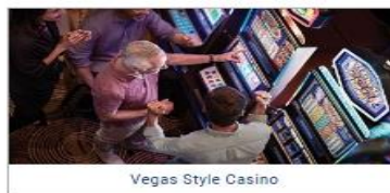
Vegas Style Casino