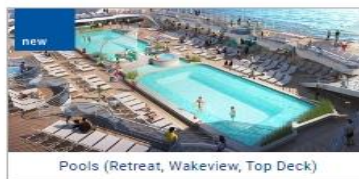
Pools (Retreat, Wakeview, Top Deck)