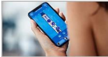
Find Your Way & Your Friends