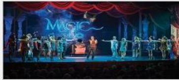
Original Musical Productions