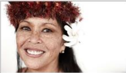
Festivals of the World