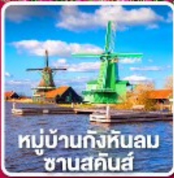
หมู่บ้านกังหันลม ซานสคีนส์

เข้าชมเทศกาล สวนดอกไม้เคอเคนฮอฟ 1 ปีมีครั้งเดียว