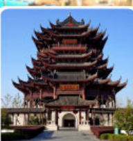
วัดดงหยวน