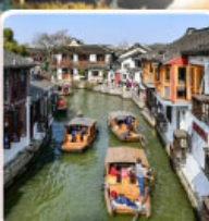
หมู่บ้านโบราณจูเจียเจียว