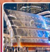
เรือหุหลู่