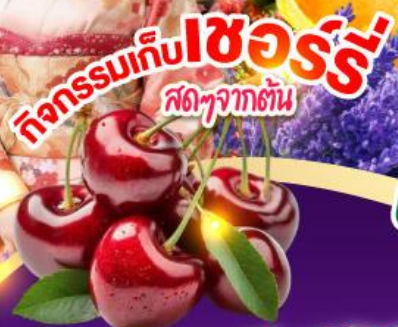
ทุ่งดอกลาเวนเดอร์ ไทมิตะฟาร์ม