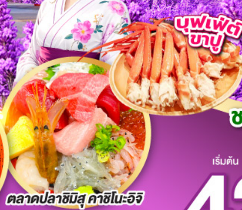
ตลาดปลาซิมิสุ คาชิโนะอิจิ