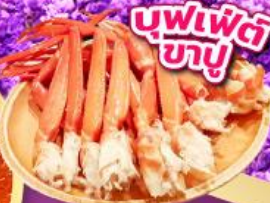
บุฟเฟ่ต์ ขาปู