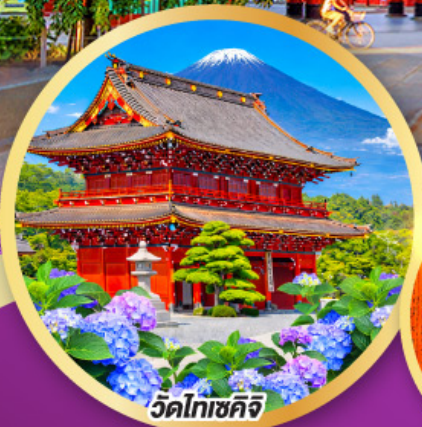
วัดโทเซคิจิ