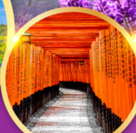
ศาลเจ้าฟุชิมิอันริ