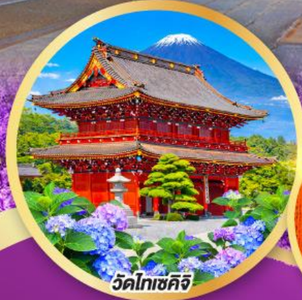
วัดโทเซคิจิ