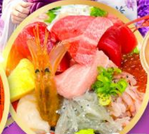
ตลาดปลาฮิมสุ คาชิโนะอิจิ